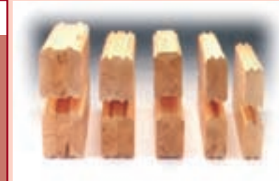
grosos de la madera