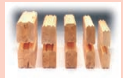
grosores de la madera