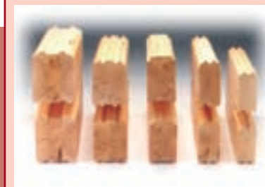
grosos de la madera