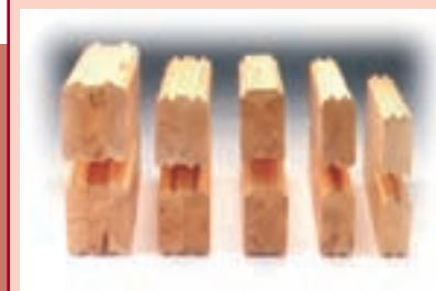
grosores de la madera